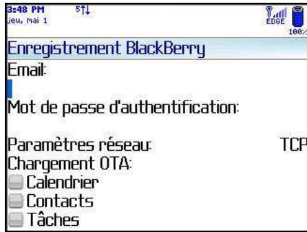
Ecran d'Enregistrement NotifyLink - TCP