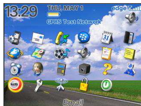
Le icone NotifyLink visualizzate dopo aver completato l'installazione.

Scaricare il file Notify BlackBerry Installer sull'apparecchio e usarlo per installare l'applicazione NotifyLink Client e delle applicazioni opzionali .