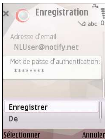
Ecran d'enregistrement de NotifyLink