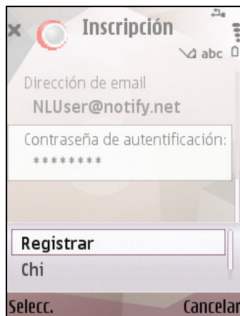
Inscripción de NotifyLink