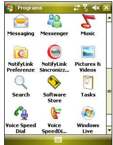
Le icone NotifyLink visualizzate dopo aver completato l'installazione.